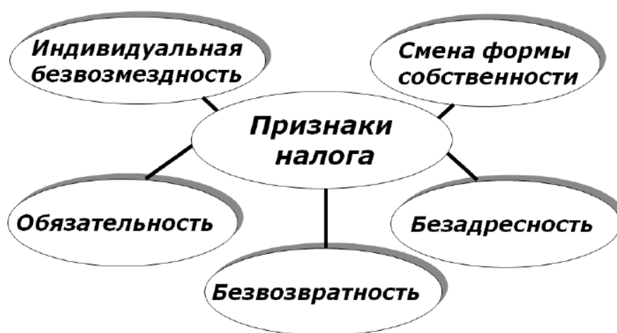
Рис. 1 – Признаки налога

Признаки налога представлены на рисунке 1.