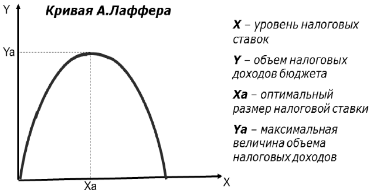
Рис. 2. Кривая Лаффера

Исследуя связь между величиной налоговой ставки и поступлением налогов в бюджет американский экономист Артур Лаффер показал, что повышение налогов может привести к снижению поступлений в бюджет. Смысл кривой в том, что снижение предельных ставок и вообще налогов обладает мощным стимулом воздействия на производство. При сокращении ставок база налогообложения в конечном счете увеличивается (выпускается больше продукции, доходы людей растут, растут налоги) (рисунок 2).